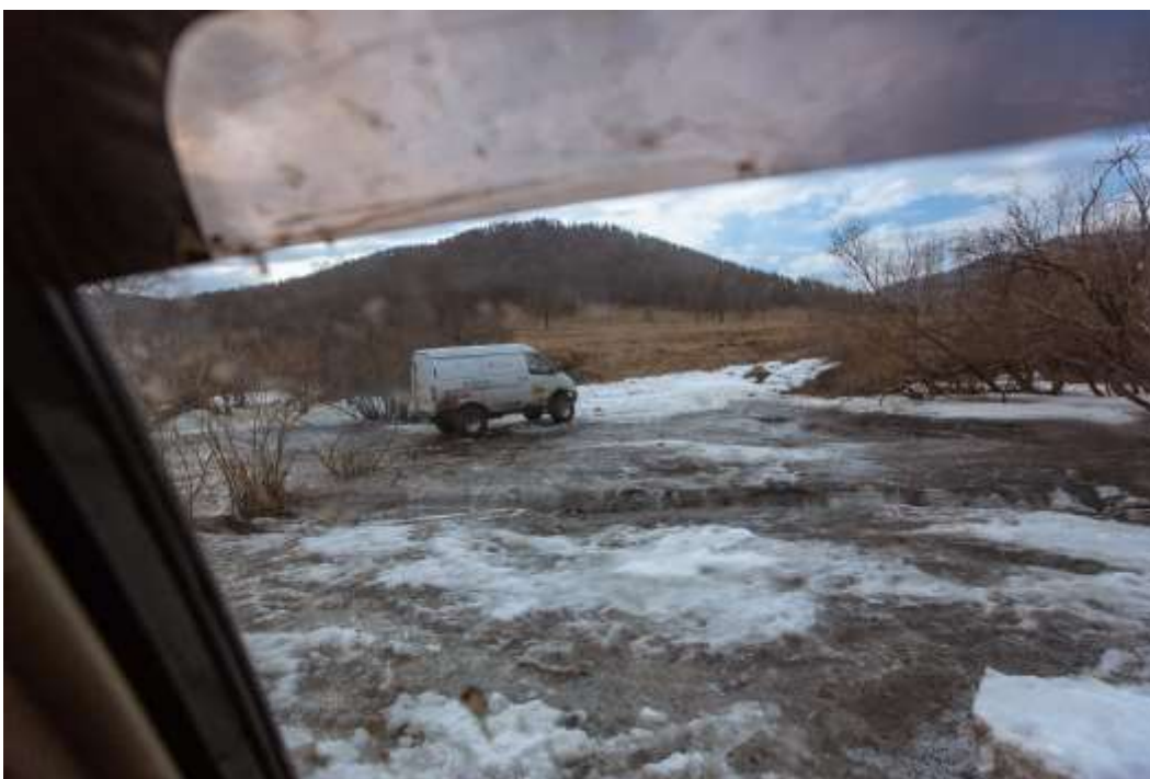
6.4. Участок дороги Беш-Озек - Шебалино. Перевал Кудатинский 1550м, уклон 13°. ЛП 3 к.т. Грунтовая дорога. Местами дорога размыта ручьями, грязь, лужи, на спуске с перевала участки покрытые снегом и льдом.