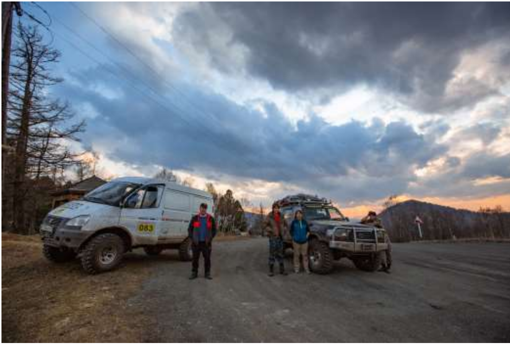
Проходим один за другим два перевала Верх-Апшухтинский и Каспинский.